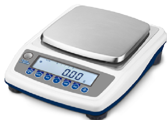
precizna tehtnica VT-HLD